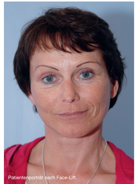
Patientenporträt nach Face-Lift.

von innen tragen kann. Am Ende der Operation muss ich die Haut gar nicht ziehen, sondern streiche sie nur aus und entferne den Überschuss. Diese Methode ist tatsächlich der Durchbruch der Face Lift Chirurgie gewesen.“