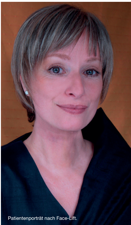
Patientenporträt nach Face-Lift.

Die Chirurgen erklären, dass dabei eben auch die Augenbrauen absacken und sich in dem Moment ein Pseudohautüberschuß im Oberlidbereich vorschiebt. Dieser wird häufig fälschlicherweise mit einer Oberlidstraffung