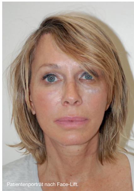
Patientenporträt nach Face-Lift.