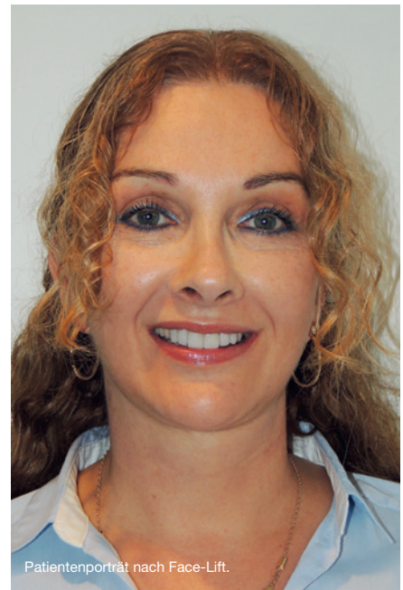
Patientenporträt nach Face-Lift.