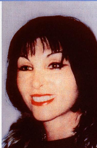
Face-Stirn-Lift mit SMAS

Das Heilmittelwerbegesetz verbietet uns leider das Anzeigen von Vorher-Nachherbildern. Jedoch können Sie im Infocenter einen Zugang zu unserem geschützten Bereich beantragen.