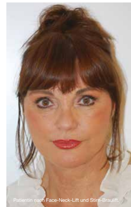
Patientin nach Face-Neck-Lift und Stirn-Brauilift.