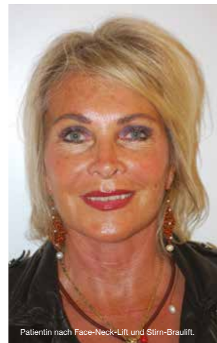
Patientin nach Face-Neck-Lift und Stirn-Brauilift.

Ästhetik am Ammersee Seestrasse 43 82211 Herrsching am Ammersee Phone: +49 (0) 8152 29150