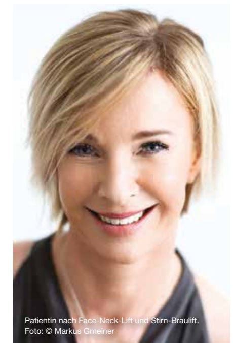
Patientin nach Face-Neck-Lift und Stirn-Brauilift.