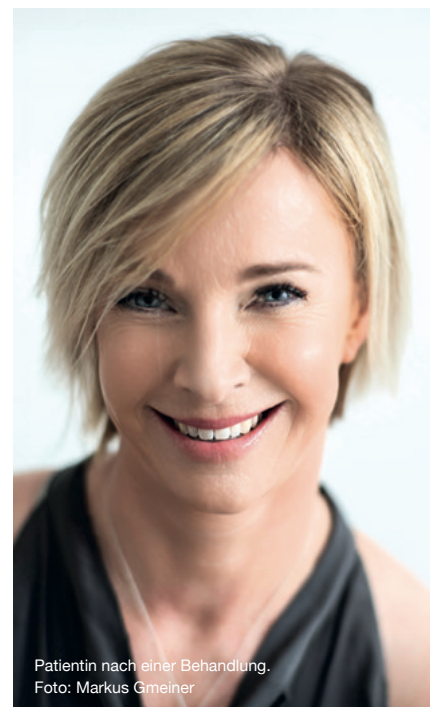
Patientin nach einer Behandlung.