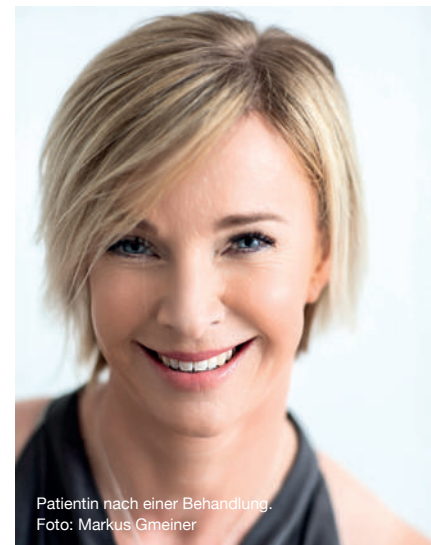
Patientin nach einer Behandlung.