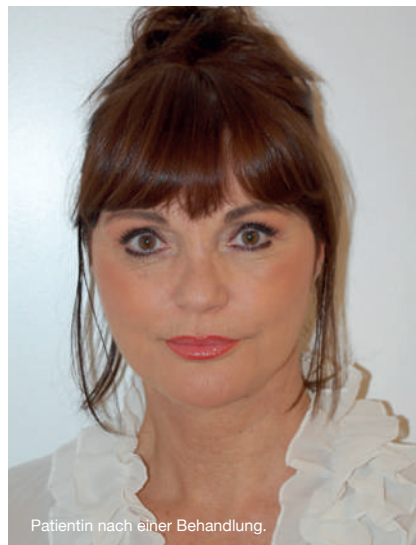
Patientin nach einer Behandlung.