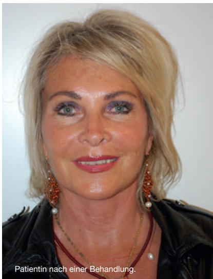
Patientin nach einer Behandlung.