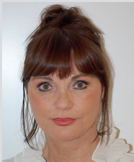
Patientenportrait nach Facelift

WIE MIT SINN FÜR ÄSTHETIK UND STREBEN NACH PERFEKTION OPTIMALE BEHANDLUNGSERGEBNISSE MIT DEM MODERNEN FACELIFTING ERREICHT WERDEN KÖNNEN