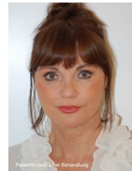
Patientin nach einer Behandlung.