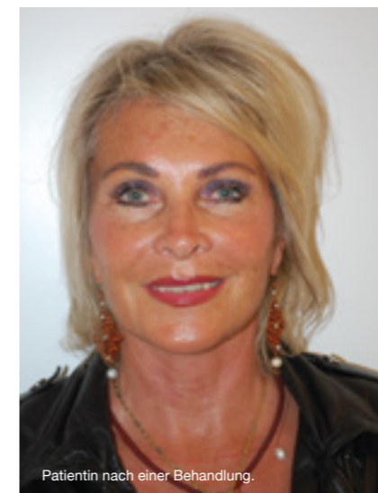
Patientin nach einer Behandlung.