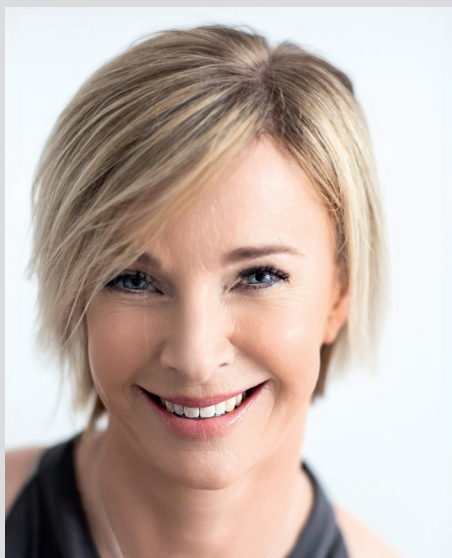
Patientenportrait nach Facelift

Die Ästhetische Chirurgie braucht ein Höchstmaß an ethischer Verantwortung und Schönheitssinn des behandelnden Plastischen Chirurgen. Unser langjähriges und erfolgreiches Behandlungskonzept ist das natürliche, unoperierte Aussehen. Wir bringen wieder die frische und wache Ausstrahlung zum Vorschein, die durch den natürlichen Alterungsprozess eines Jeden über die Jahre hinweg verlorgen gegangen ist. Die Zufrieden-