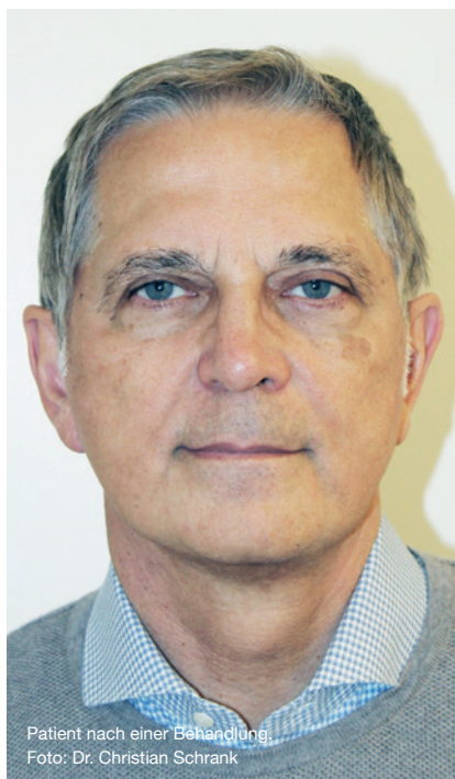
Patient nach einer Behandlung.