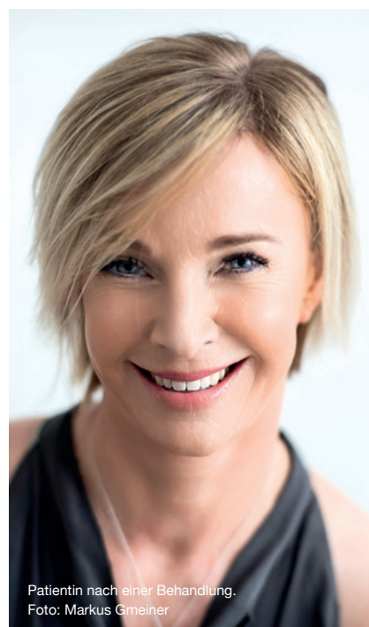
Patientin nach einer Behandlung.