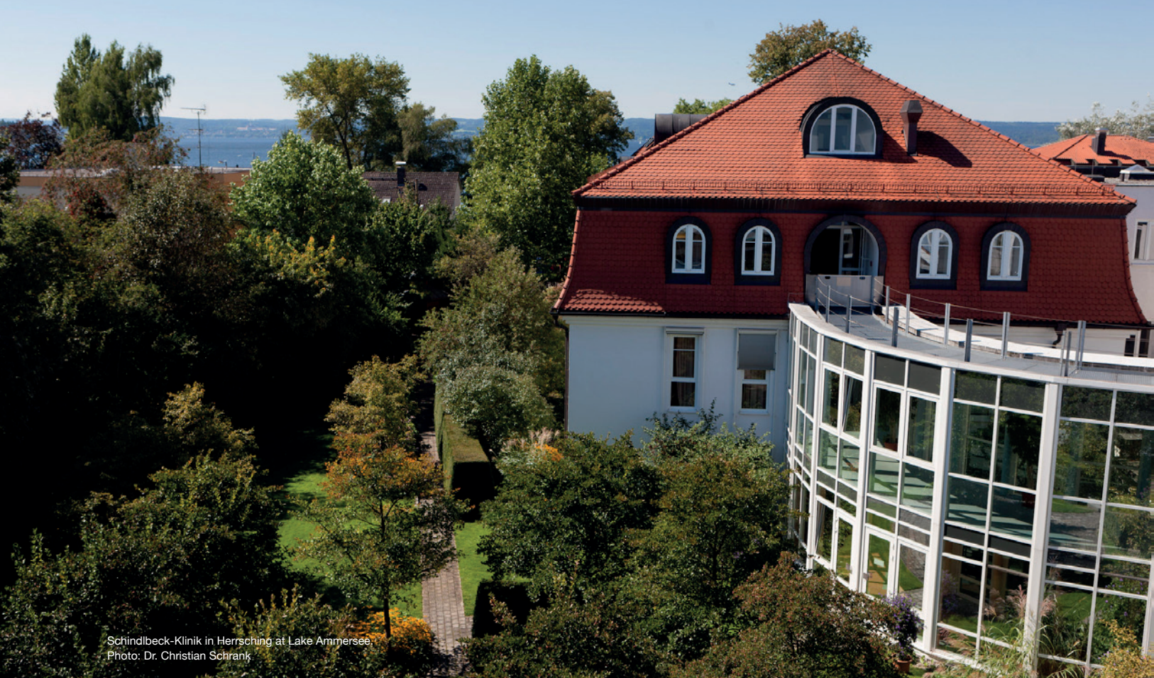
Schindlbeck-Klinik in Herrsching at Lake Ammersee.