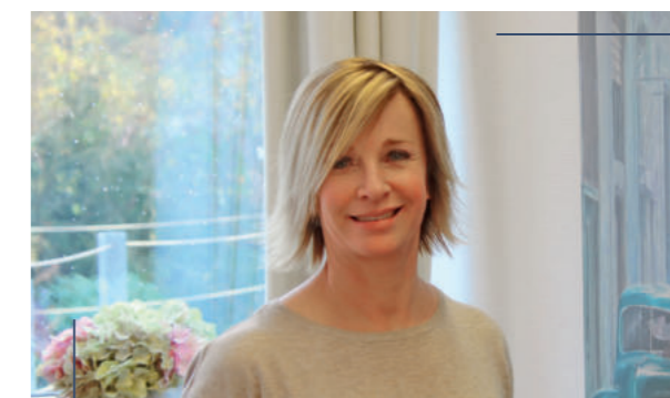
Glücklich mit dem verjüngten Gesicht