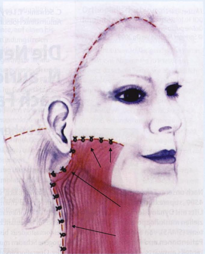
Abb. 2 ► Vektoriale Ausdehnung und Fixierung des SMAS

periaurikulären Region. Diese verschwanden entweder im Lauf der Wundheilung oder konnten mit konservativen Behandlungsmaßnahmen (orale Analgesie bzw. Entzündungshemmung mit z. B. Diclofenac, orale Gabe von Vitamin-B-Komplex, örtliche Infiltration von Lokalanäs-