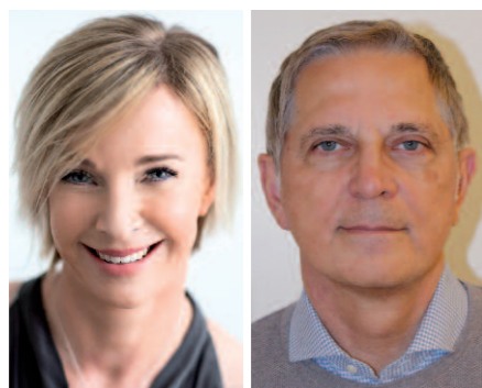
Patientin nach Facelift Patient nach Facelift

„Natürlich versuchen wir, im Gespräch mit dem Patienten herauszufinden, welche